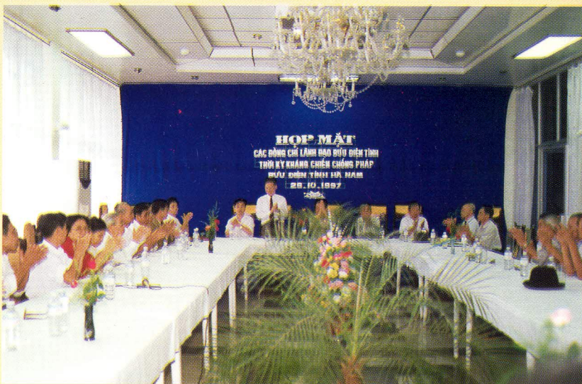
Quang cảnh buổi họp mặt các đồng chí Lãnh đạo tỉnh và Lãnh đạo Bưu điện tỉnh thời kỳ kháng chiến chống Pháp (ngày 26 tháng 10 năm 1997)