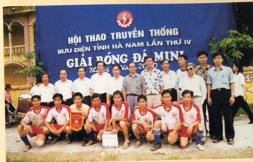
Ban Tổ chức Hội thao Bưu điện tỉnh chụp ảnh lưu niệm với đội đạt giải Nhất bóng đá mi-ni (tháng 8 năm 2000)