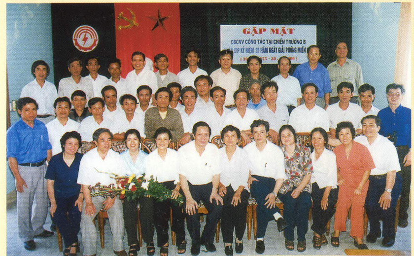
Lãnh đạo Bưu điện tỉnh Hà Nam gặp CBCNV công tác tại chiến trường B nhân dịp kỷ niệm 25 năm ngày giải phóng miền Nam (30/4/1975 - 30/4/2000)