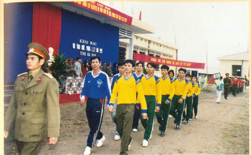
Trung đội Tự vệ Bưu điện tỉnh điều hành qua khán đài trong Lễ Khai mạc Hội thao Quốc phòng Lục lượng vũ trang chào mừng 55 năm ngày thành lập Quân đội Nhân dân Việt Nam và 10 năm ngày hội quốc phòng toàn dân (ngày 22 tháng 12 năm 1999)