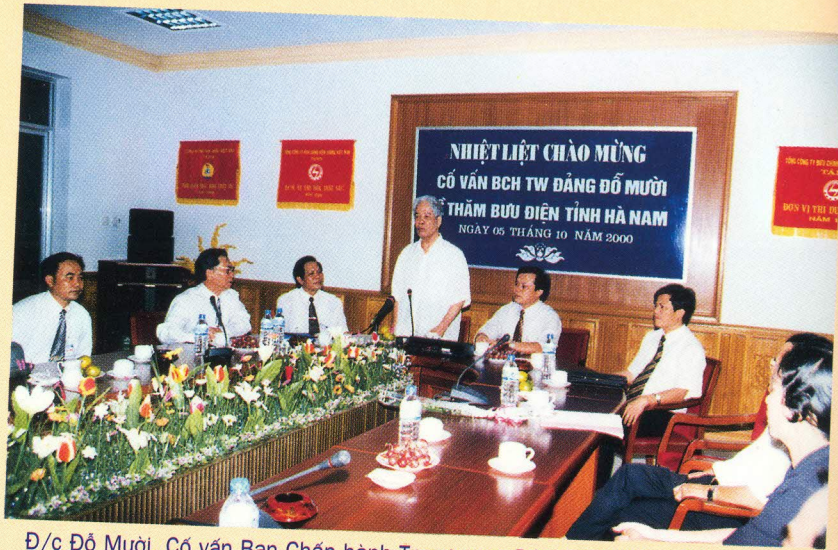
Đ/c Đỗ Mười, Cố vấn Ban Chấp hành Trung ương Đảng phát biểu với Lãnh đạo, CBCNV nhân dịp về thăm Bưu điện tỉnh Hà Nam (ngày 05 tháng 10 năm 2000)