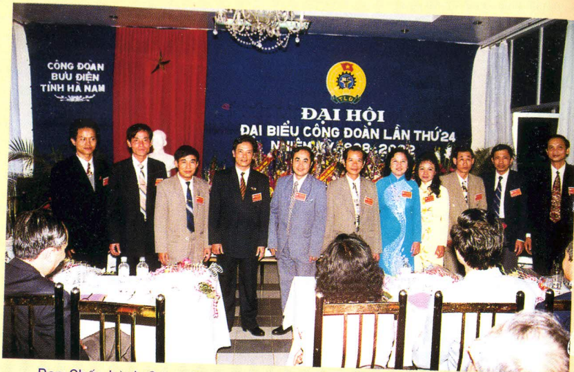
Ban Chấp hành Công đoàn Bưu điện tỉnh Hà Nam nhiệm kỳ 1998 - 2002