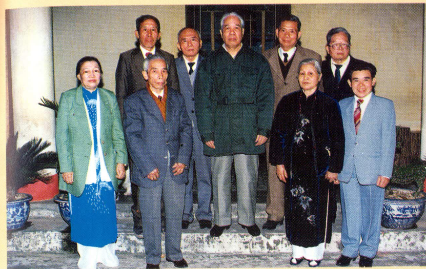
Các đồng chí Lãnh đạo và cán bộ Bưu điện tỉnh Hà Nam (thời kỳ 1950 - 1955) đến chúc thượng thọ đ/c Đỗ Mười, Cố vấn Ban Chấp hành Trung ương Đảng nhân dịp sinh nhật lần thứ 80 (ngày 02/02/1997)