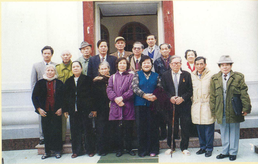
Các đồng chí Lãnh đạo Bưu điện tỉnh Hà Nam chụp ảnh lưu niệm với các cán bộ lão thành cách mạng nguyên là lãnh đạo và cán bộ Bưu điện tỉnh Hà Nam thời kỳ 1950 - 1955 nhân buổi họp mặt đầu Xuân 1998 tại 18 Nguyễn Du, Hà Nội