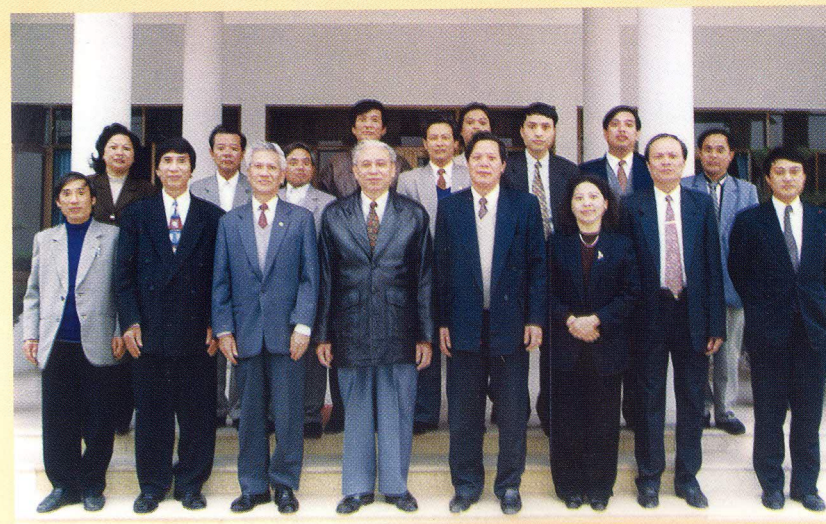
Các đồng chí Lãnh đạo Tổng cục Bưu điện, Tổng Công ty BCVT Việt Nam, Công đoàn Bưu điện Việt Nam về thăm, làm việc và chụp ảnh lưu niệm với Lãnh đạo, CBCNV Bưu điện tỉnh Hà Nam (ngày 18 tháng 12 năm 1998)