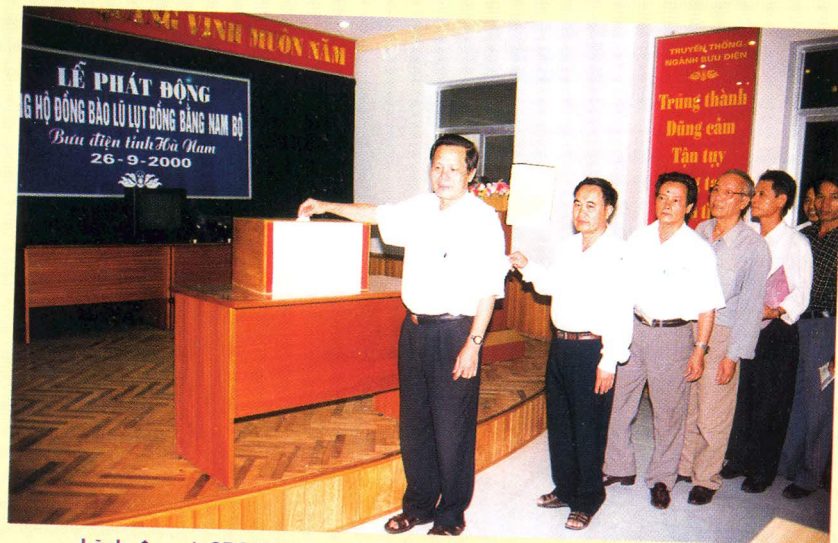
Lãnh đạo và CBCNV Bưu điện tỉnh Hà Nam ủng hộ đồng bào bị lũ lụt ở đồng bằng Nam Bộ (ngày 26 tháng 9 năm 2000)