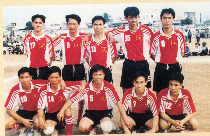
Đội tuyển bóng đá mi-ni (07 người) của Bưu điện tỉnh đạt giải vô địch tỉnh Hà Nam năm 2000 (ngày 30 tháng 12 năm 2000)